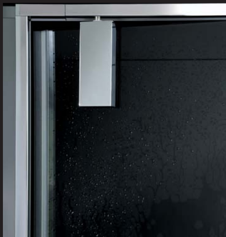
Charnières intégrées au verre pour faciliter le nettoyage