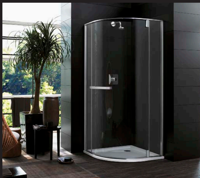
Paroi d'angle S550 porte pivotante, 1700 €*