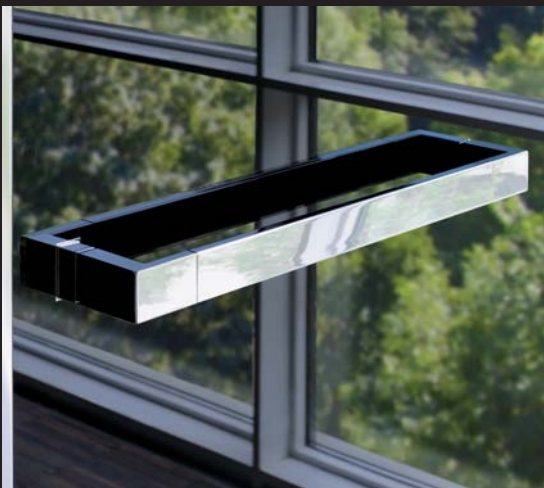
Poignée de porte