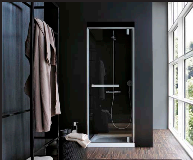
Paroi en niche S550 porte pivotante, à partir de 900 €*