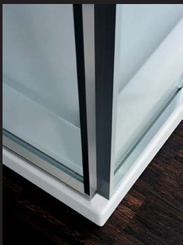
Profilé aluminium argent brillant